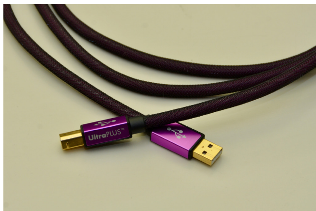
XLO Ultra Plus其實也是不錯的線，不比較的話完全可以接受。