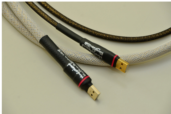
樂音Airy Silver Reference MK. III USB與Klangfilm USB線，都很超值。