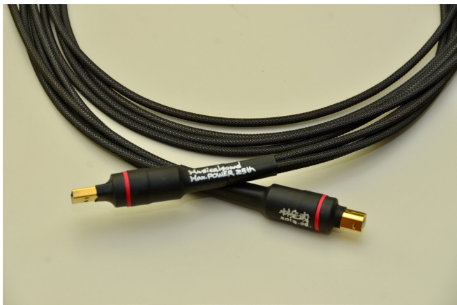
四線版樂音Max Power 25週年紀念USB線，值得收藏的線啊！