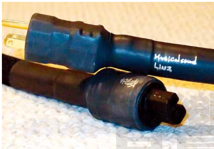
樂音The Linz電源線，管機（尤其是單端管機）最佳良伴。

所有MaxPower系列的線都有類似的聲底，就是寬鬆、大器、飽滿與極真實的樂器人聲質感。這對MaxPower Klangfilm自然也不例外。不過剛開始試聽的時候，MaxPower Klangfilm聲音並不是那麼放得開，聽起來帶點拘謹，高低二端的延伸都只是普普通通，像是在聽好一點的全音域單體。我將MaxPower Klangfilm放在前後級之間，用各種音樂煲了幾百小時以後，MaxPower Klangfilm豁然開朗，高低二端的延伸就不用多說了，速度之快、動態之凌厲、細節之豐富，讓人無法想像這是一對用古董線芯製作出來的訊號線。目前我將MaxPower Klangfilm換到訊源與前級之間，前後級之間改用更粗壯威猛的MaxPower 2.5純銀平衡線，整體效果比二對線反過來用更好。