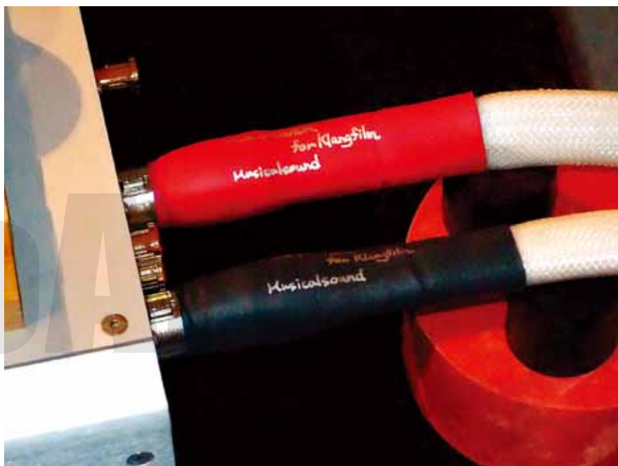
樂音的MaxPower Klangfilm訊號線，新與舊最佳兩全方案。

我手上這對MaxPower Klangfilm（平衡版定價20,000台幣，如果是RCA版，則是18,000元）其實不